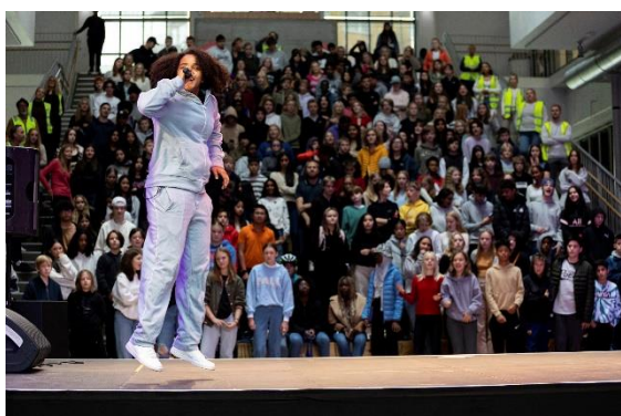
Fra Kulturfest Frydenberg på Frydenberg skole i Oslo. Arrangert av DKS Oslo og Miniøya i september 2021