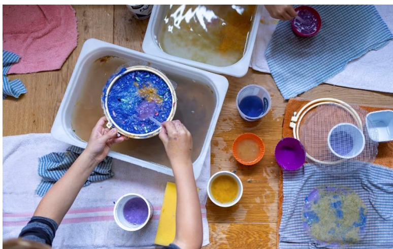
"Resikunst" - papirhåndverk med elever 1.-4. trinn.