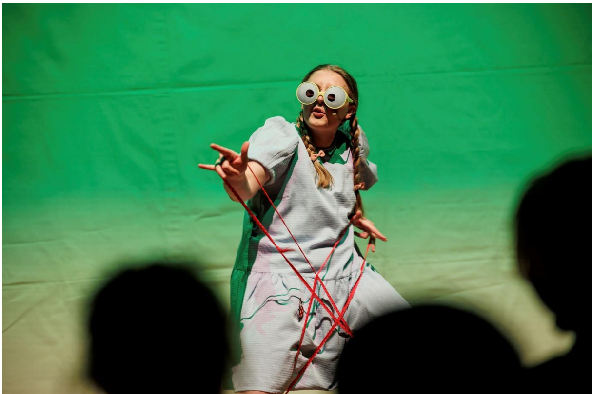
Konsert med «Hit eit sted» under Spot on på Marked for musikk i 2021